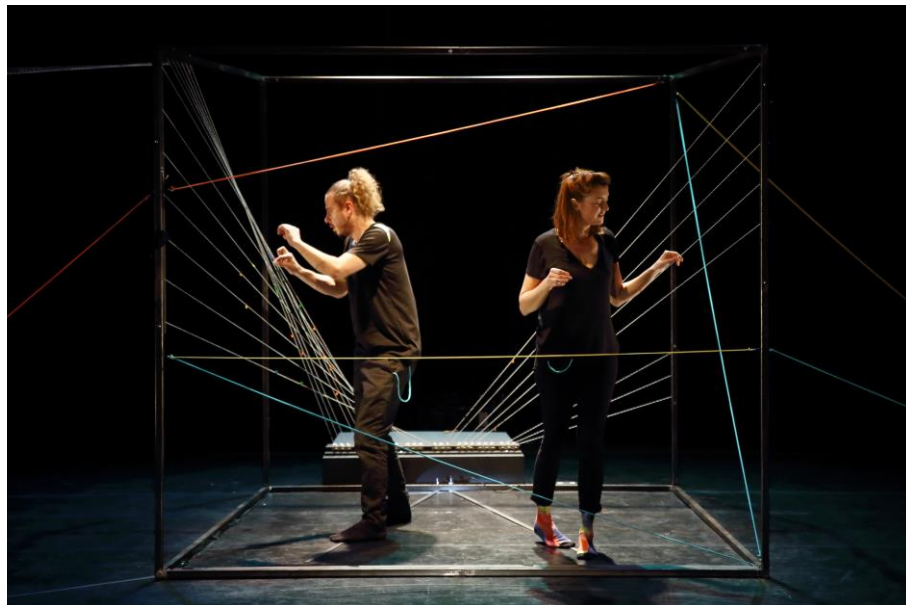
La structure musicale: le Filophone

Le « Filophone » est une structure musicale spécifiquement conçue et réalisée pour le spectacle Des yeux pour te regarder . Sur la structure, plusieurs fils sont reliés à un « playtron », un contrôleur midi capable d'assigner un son à n'importe lequel de ces fils.