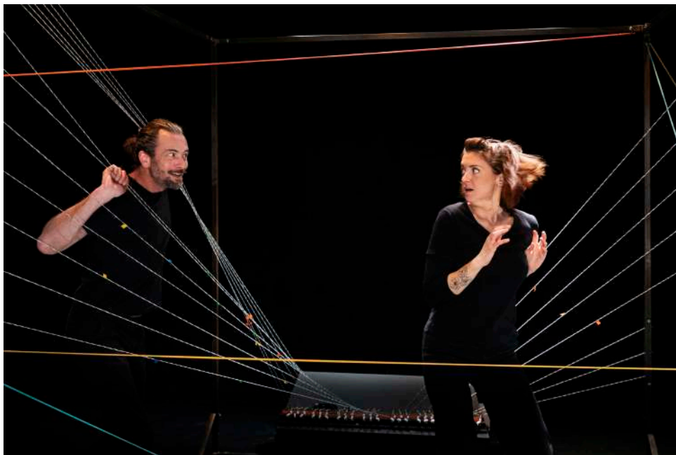
La structure musicale: le Filophone © Grégoire Édouard

Le « Filophone » est une structure musicale spécifiquement conçue et réalisée pour le spectacle Des yeux pour te regarder . Sur la structure, plusieurs fils sont reliés à un « playtron », un contrôleur midi capable d'assigner un son à n'importe lequel de ces fils.