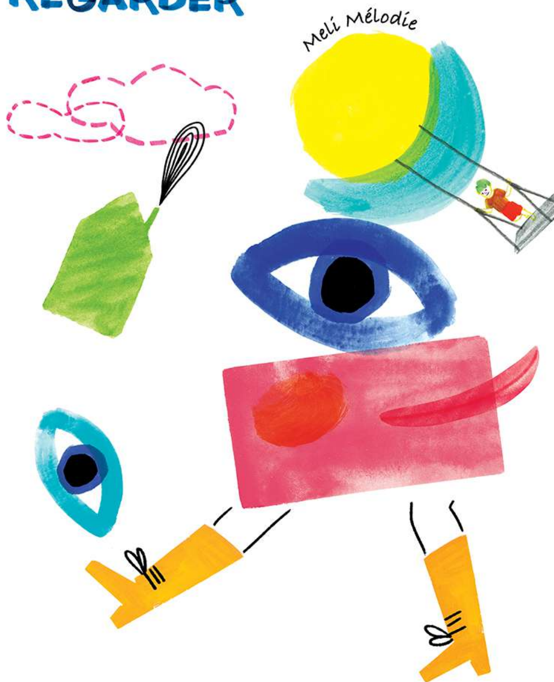
Illustration et design officielle : ELIS WEIK